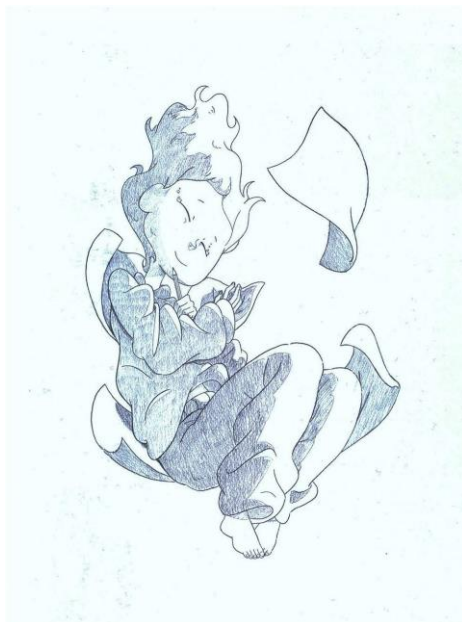
Opera di Patrick Sfeir

Studiare e, per tutti i bambini del mondo, vivere al sicuro, questo desidero.