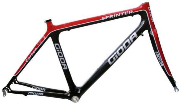
1 - TELAIO DELLA BICICLETTA