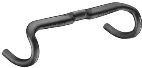
3 - MANUBRIO