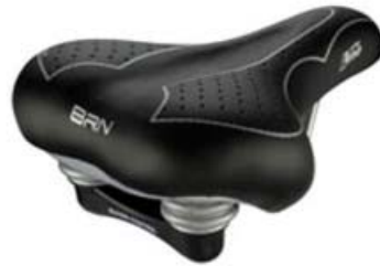
2 - SELLINO