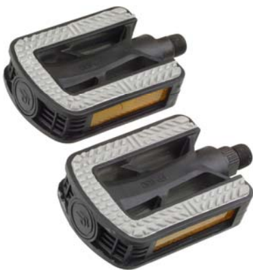
5 - PEDALI