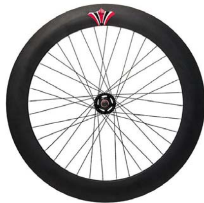
6 - SECONDA RUOTA