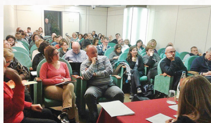
Partecipanti al primo weekend 13 da Cuneo e Fossano

Il progetto del Master regionale nasce in continuità con la Nota Pastorale della Conferenza Episcopale Piemontese sull'Iniziazione Cristiana dei bambini (Una Chiesa Madre, gennaio 2013) e ne vorrebbe favorire la ricezione. In particolare "mira a sostenere la costituzione di équipe diocesane capaci di elaborare un progetto di Iniziazione Cristiana dei bambini (...), di costruire legami con le parrocchie, di promuovere percorsi di formazione degli operatori della pastorale battesimale e di offrire l'opportuna